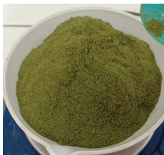
Gambar 1. Simplisia Serbuk Daun Waru

Hasil simplisia yang telah dikeringkan kemudian dilakukan proses penyerbukan, serbuk simplisia yang dihasilkan yaitu 512,12 g. Hasil pembuatan simplisia daun waru ditunjukkan pada gambar 1.